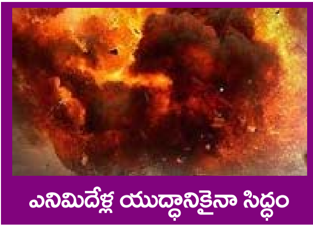
అనిమిదేశ్ యుద్ధానికైనా సిద్ధం

PUBLISHED FROM HYDERABAD CIRCULATED BY RANGAREDDY, NALGONDA, KHAMMAM, KARIMNAGAR, WARANGAL, MAHABOONAGAR, MEDAK, NIZAMABAD, ADILABAD