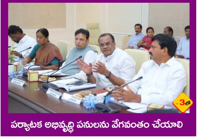
పర్యాటక అభివృద్ధి పనులను వేగవంతం చేయాలి

PUBLISHED FROM HYDERABAD CIRCULATED BY RANGAREDDY, NALGONDA, KHAMMAM, KARIMNAGAR, WARANGAL, MAHABOONAGAR, MEDAK, NIZAMABAD, ADILABAD