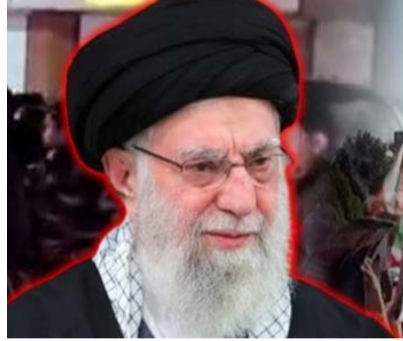
అమెరికా యుద్ధ నౌకపై క్షిపణులు పేల్చామన్న ఐఆర్జీసీ ఖమేనీ వారసుడి ఎన్నిక నేడే రేపా.. హత్యపై ప్రపంచవ్యాప్తంగా పలుచోట్ల నిరసనలు

యుద్ధం తొలి రోజే ఇరాన్ సుప్రీం నేత మరణం 40 మంది అత్యున్నత సైనికాధికారులు కూడా ఇజ్రాయెల్, గల్ఫ్ దేశాలపై ఇరాన్ భీకర ప్రతీకార దాడులు విమానాశ్రయాలు, బస్సు ఖులిఫా సహా పలు భవనాలకు నష్టం ఆయా దేశాల్లో పలువురి మరణం.. గాయాలు నిలిచిపోయిన విమానాలు.. చిక్కుకుపోయిన వేల మంది ఇరాన్ దాడి చేసిన నౌకలో భారతీయులు