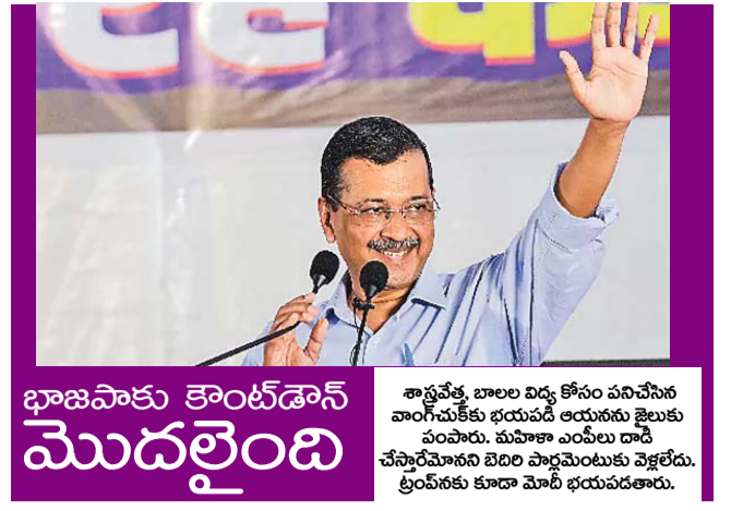
భాజపాకు కౌంటడౌన్ మొదలైంది

శాస్త్రవేత్త బాలల విద్య కోసం పనిచేసిన వాంగ్మతీకు భయపడి ఆయనను జైలుకు పంపారు. మహిళా ఎంపీలు దాడి చేస్తారేమోనని బెదిరి పార్లమెంటుకు వెళ్లలేదు. ట్రాన్స్ జనతా కూడా మోడి భయపడతారు.