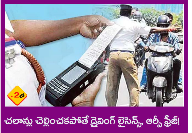
చలాన్లు చెల్లించకపోతే డ్రైవింగ్ లైసెన్స్, ఆర్సీ ప్రిజ్!

PUBLISHED FROM HYDERABAD CIRCULATED BY RANGAREDDY, NALGONDA, KHAMMAM, KARIMNAGAR, WARANGAL, MAHABOONAGAR, MEDAK, NIZAMABAD, ADILABAD