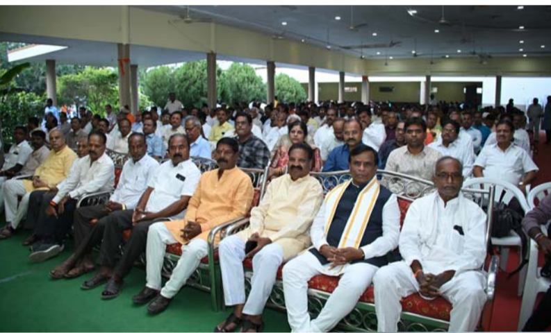
ఉగాది ఉత్సవాల్లో అర్జన్ ఎమ్మెల్యే ధన్వల్ సూర్యనారాయణ గుప్తా.