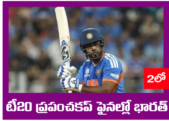
2లో టీ20 ప్రపంచకప్ ఫైనల్స్ భారత్

PUBLISHED FROM HYDERABAD CIRCULATED BY RANGAREDDY, NALGONDA, KHAMMAM, KARIMNAGAR, WARANGAL, MAHABOONAGAR, MEDAK, NIZAMABAD, ADILABAD