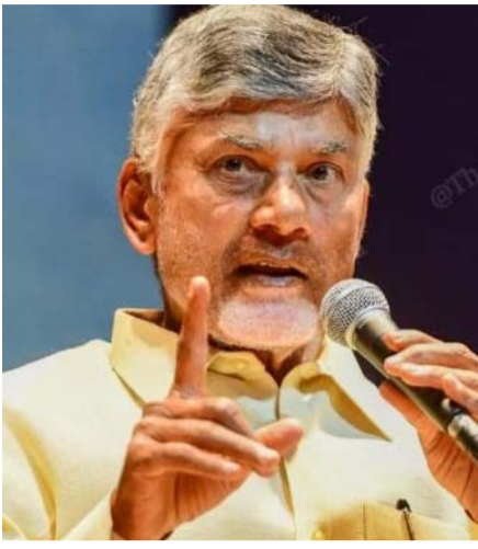
ప్రకారం రాష్ట్రంలో ఏటా 6.70 లక్షల జననాలు నమోదవుతున్నాయని తెలిపారు. ఇలాగే కొనసాగితే 2047 నాటికి జనాభాలో 23 శాతం మంది వృద్ధులు ఉంటారని అన్నారు. మహిళల లీడర్ ఫోర్చు పాలసీపేషన్ రేట్ ప్రస్తుతం 31 శాతంగానే ఉంటుందని.. ఇది 59 శాతానికి చేరితే రాష్ట్ర జీఎన్పీ 15 శాతం పెరుగుతుందని ముఖ్యమంత్రి తెలిపారు.

యోచిస్తున్నామన్నారు. విశాఖపట్టణంలో రూ.172 కోట్లతో వర్సింగ్ ఉపాధి కార్యక్రమం చేపడుతున్నామని తెలిపారు. మహిళా ఉద్యోగులు ఎక్కువగా పనిచేసే ప్రాంతాల్లో కొత్త వర్సింగ్ ఉపాధి కార్యక్రమం చేయాలని నిర్ణయించామన్నారు. మూడో సంతానం, ఆపై జననాలకు తల్లిలకు 12 నెలల పేరెంటల్ లీప్, తండ్రులకు 2 నెలల పేటర్నల్ లీప్ ఇవ్వాలని ఆలోచిస్తున్నామని అన్నారు. త్వరలో 'తల్లిదండ్రుల అవకాశాల సమాన బాధ్యత' పేరుతో కుటుంబ బాధ్యతలను పంచుకోవడంపై అవగాహన క్యాంపెయన్ నిర్వహిస్తున్నామని సీఎం తెలిపారు. 2047 నాటికి ఏపీలో వృద్ధుల జనాభా 23 శాతం ఉంటుందని అంచనా వేస్తూ, ప్రతి జిల్లాలో వృద్ధుల సంరక్షణకు ప్రత్యేక వార్డులు ఏర్పాటు చేయాలని నిర్ణయించామన్నారు. సీఎం. 175 సీహెచ్సీలతో రెండు వారాలకు ఒకసారి ప్రత్యేక క్లినిక్ నిర్వహిస్తున్నామని తెలిపారు. సిల్వర్ సిల్వర్ వెల్ఫేర్ డ్వారా 50,000 రిటైర్డ్ ప్రొఫెషనల్స్ను మెంటరింగ్లో భాగం చేస్తామన్నారు. రిటైర్డ్లకు ముందే ఉద్యోగం కలిగి వేతనం లీప్, రూ.50,000 ఆరోగ్య నిధి అందిస్తామని ముఖ్యమంత్రి చంద్రబాబు నాయుడు పేర్కొన్నారు.