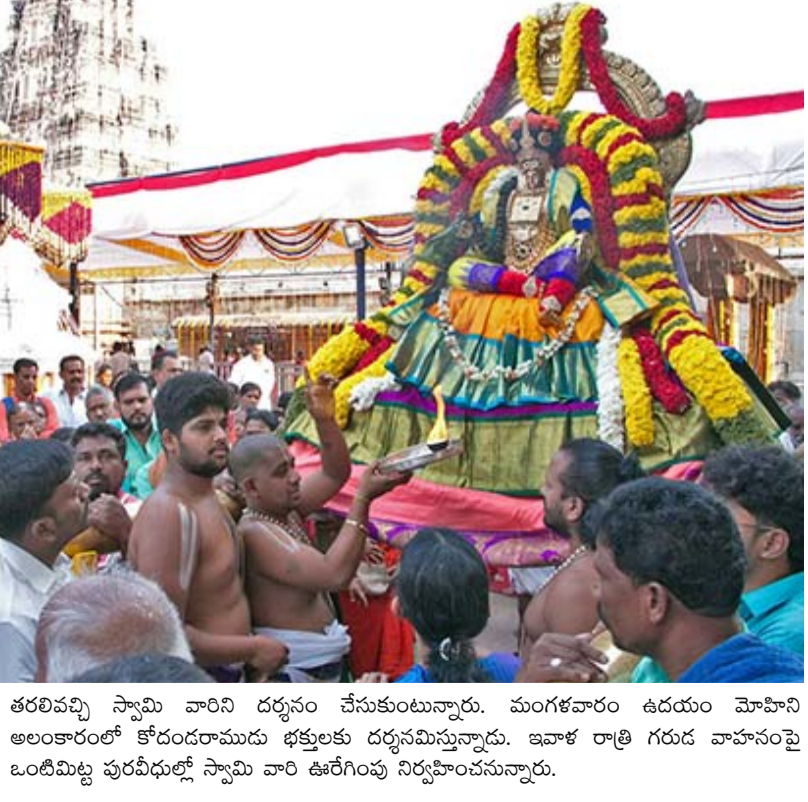
తరలివచ్చి స్వామి వారిని దర్శనం చేసుకుంటున్నారు. మంగళవారం ఉదయం మోహినీ అలంకారంలో కోదండరాముడు భక్తులకు దర్శనమిస్తున్నాడు. ఇతర రాత్రి గురు వాహనంపై ఒంటిమిట్ట పురవీధుల్లో స్వామి వారి ఊరేగింపు నిర్వహించనున్నారు.