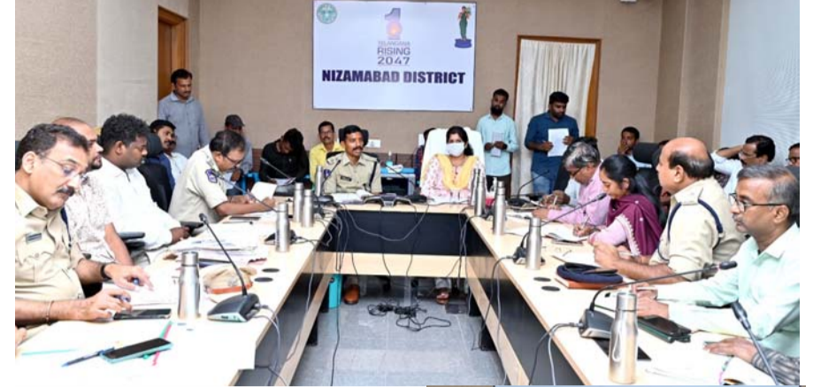
కలెక్టర్ ఇలా త్రిపాలి.రోడ్డు భద్రతా కమిటీ సమావేశంలో దిశా నిర్దేశం.

నేతలు రెండు వర్గాలకు మించి పోటీ చేసే అవకాశం లేకుండా చూడాలి. ఒకే దేశం, ఒకే ఎన్నిక అనేది బీజేపీకి ప్రయోజనాలను సమకూరుస్తుందనే వాదనలో పసలేదు. పార్లమెంటు, రాష్ట్ర శాసనసభల ఒకేసారి ఎన్నికలు జరపడం వల్ల అధికారంలో ఉన్న పార్టీకి పరిస్థితులు అనుకూలమవుతాయని వితండ్ వాదనతో దీనిని వ్యతిరేకిస్తున్నారు. అందుకే ఎన్నికల సంస్కరణ అనేది ఓటర్లకు సంబంధించినది మాత్రమే కాదు. యావత్తు భారత జాతికి సంబంధించినది. ఇది పార్లమెంటులో ప్రస్తుతం ఉన్న ఎంపీల వ్యవహారం అన్నలు కానేవారు. తమను అత్యున్నత చట్టసభకు తీసుకువచ్చి, తద్వారా అధికారాన్ని అప్పగించిన ఓటర్లు తమ ఓటు దుర్వినియోగం కాకుండా చూసుకోవాల్సి ఉంది. పటిష్టమైన ప్రజాస్వామ్య వ్యవస్థ కోసం నియమ నిబంధనలను మార్చాలి. అవశ్యకత విషయమై పార్లమెంటేరియంను అనుసరించాలి. అలాగే ఎన్నికలలో ధనబలం, కండ్లబలం ప్రభావాన్ని తగ్గించేందుకు తీసుకురావాల్సిన చట్టాల గురించి చర్చించాలి. ఎన్నికల సమగ్రత, నిష్పాక్షికత చాలా ముఖ్యం అని విషయం ఇక్కడ గుర్తించాలి. ఎన్నికల వ్యవస్థలో ఉన్న లోపాల కారణంగా రాజకీయ నేతలు అనుసరిస్తున్న వికృతాలను నిరోధించేందుకు పార్లమెంటు చర్చించడం కూడా ముఖ్యం. ప్రధానంగా ప్రజల భాగస్వామ్యం పెరగాలి. పేదలైన ప్రజలకు చట్టసభల్లో ప్రవేశించే అవకాశం రావాలి. అవసరమైతే ఇందుకు నిబంధనలు లేదా రిజర్వేషన్లు పెట్టాలి. చట్టసభల్లో నిరంతరం కొత్తవాళ్లు ఎన్నికలైతేనే అవినీతి, మోసాపతి తగ్గుతుంది.