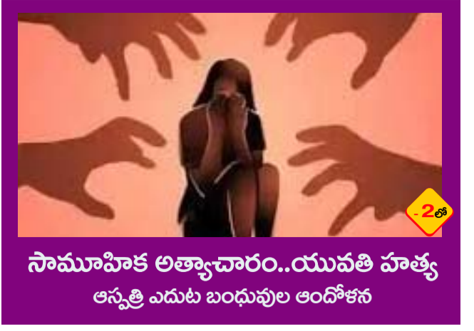
సామూహిక అత్యాచారం..యువతి హత్య ఆస్పత్రి ఎదుట బంధువుల ఆందోళన

PUBLISHED FROM HYDERABAD CIRCULATED BY RANGAREDDY, NALGONDA, KHAMMAM, KARIMNAGAR, WARANGAL, MAHABOONAGAR, MEDAK, NIZAMABAD, ADILABAD