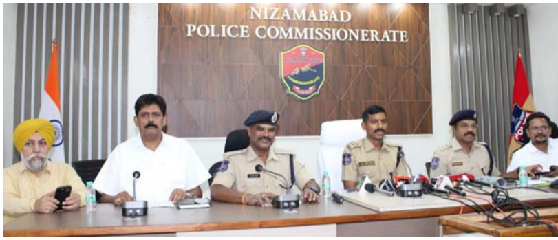
వేగుచుక్క న్యూస్, నిజామాబాద్:

నిజామాబాద్ సెక్యూరిటీ కార్పొరేషన్ - ప్రీమియర్ లీగ్.