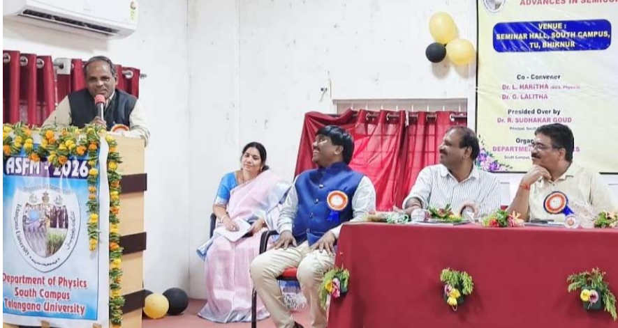
వేగుచుక్క న్యూస్, జక్కల్: