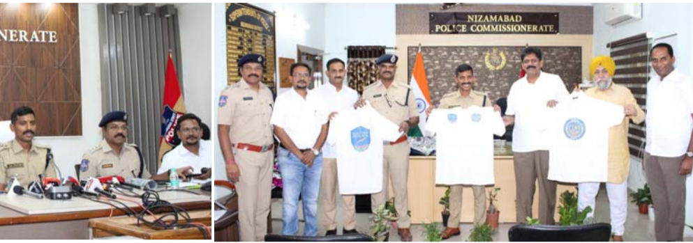
వేగుచుక్క న్యూస్, నిజామాబాద్: