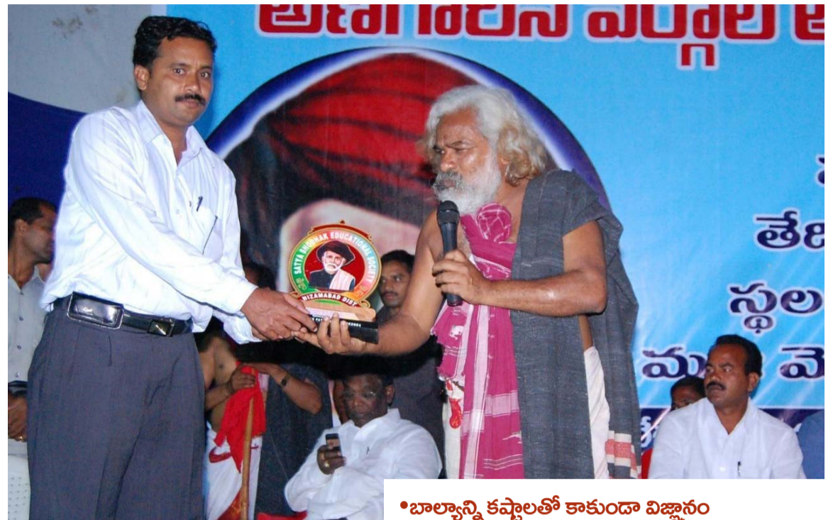
• బాల్యాన్ని కష్టాలతో కాకుండా విజ్ఞానం