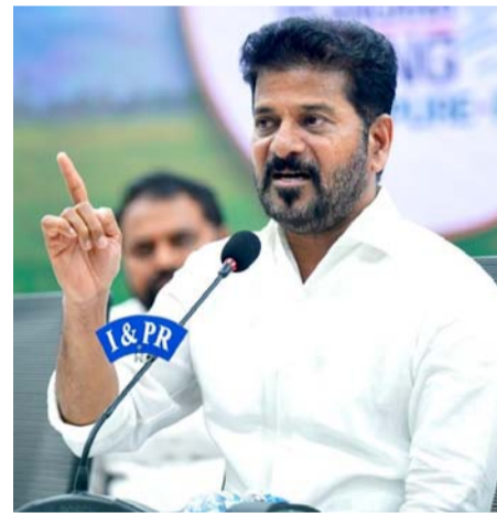
మహిళా రిజర్వేషన్ బిల్లు ఆమోదం కోసమే పార్లమెంట్ ప్రత్యేక సమావేశాలు నిర్వహిస్తున్నారని ఆయన పేర్కొన్నారు. డివిజిఎఫ్ఎన్ అనేది రాజకీయ పార్టీలకో, ప్రభుత్వాలకో సంబంధించిన అంశం కాదని స్పష్టం చేసిన సిఎం రేవంత్, దీనిని మహిళా రిజర్వేషన్లతో కలిపి చూపించడం సరైనది కాదన్నారు.

మహిళలంటే బజెపికి చిన్నచూపు 15మంది బజెపి అధ్యక్షులు మాలినా.. మహిళలకు చోటేది ముఖ్య పదవుల్లో కూడా మహిళలకు చోటివద్దని బజెపి కాంగ్రెస్లో ఇందిర, సోనియాలు అధ్యక్షులుగా పనిచేశారు బండి సంజయ్ విమర్శలు మాని నిజాలు తెలుసుకోవాలి మీడియా సమావేశంలో సిఎం రేవంత్ రెడ్డి చురకలు