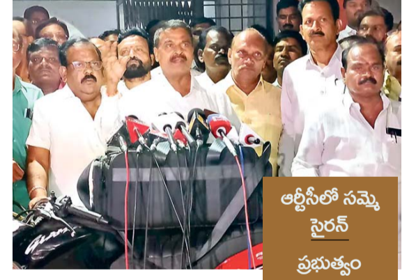
ఆర్టీసీలో సమ్మె సైరన్ ప్రభుత్వం చర్యలకు విలిసి వెళ్ళేందుకు సిద్ధం: ఆర్టీసీ జేపీసీ