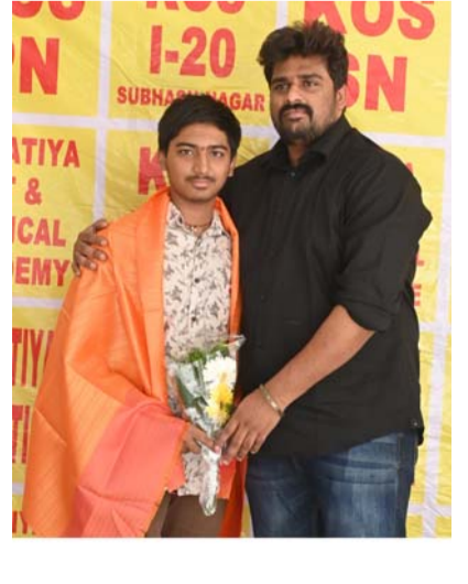
A. ATHRIJ AIR 9955 HT.NO-260310041773