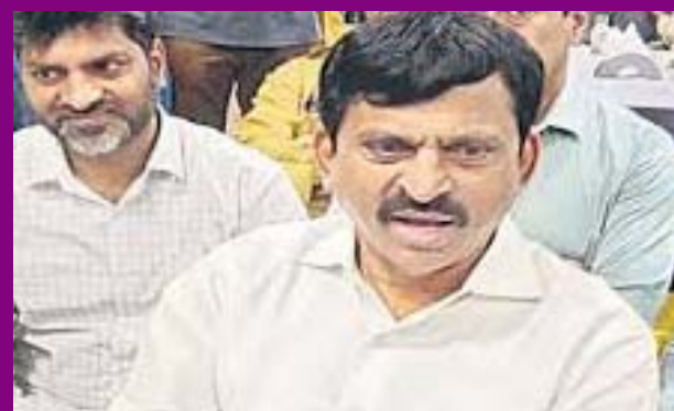
కాశీశ్వరం పై సీట్ల విచారణకు సిద్ధమా