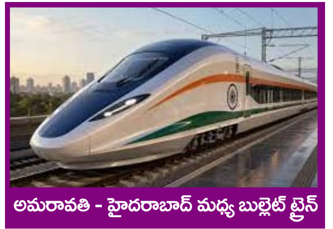
అమరావతి - హైదరాబాద్ మధ్య బుల్లెట్ ట్రైన్

PUBLISHED FROM HYDERABAD CIRCULATED BY RANGAREDDY, NALGONDA, KHAMMAM, KARIMNAGAR, WARANGAL, MAHABOONAGAR, MEDAK, NIZAMABAD, ADILABAD