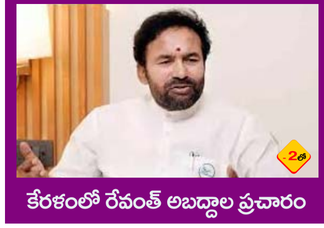
కేరళంలో రేవంత్ అబద్దాల ప్రచారం

PUBLISHED FROM HYDERABAD CIRCULATED BY RANGAREDDY, NALGONDA, KHAMMAM, KARIMNAGAR, WARANGAL, MAHABOONAGAR, MEDAK, NIZAMABAD, ADILABAD