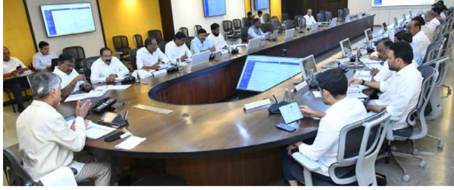
రుషికొండ భవనాల వినియోగం

అమరావతి: సీఎం చంద్రబాబు అధ్యక్షతన 16వ పెట్టుబడుల ప్రోత్సాహక బోర్డు ఎన్ఐపీఐ సమావేశం జరిగింది. రూ.39,436 కోట్ల విలువైన 31 ప్రాజెక్టులకు ఎన్ఐపీఐ ఆమోదం తెలిపింది. ఈ ప్రాజెక్టుల ద్వారా ప్రత్యక్షంగా 1,11,278 మందికి ఉద్యోగ అవకాశాలు రానున్నాయి. అమరావతి క్యాంపం వ్యాప్తంలో 3 సంస్థల ఏదర్లుకు ప్రోత్సాహక బోర్డు గ్రీన్ సిగ్నల్ ఇచ్చింది. ఏపీలో ఎలక్ట్రానిక్స్ ఉత్పత్తుల తయారీపై ప్రత్యేక దృష్టి సారించాలని ఈ సందర్భంగా చంద్రబాబు సూచించారు. సాగు వ్యూహ సర్వేయింగ్ కోసం యూనిట్ల ఏర్పాటుకు ఎన్ఐపీఐ ఆమోదం తెలిపింది. ఆధునిక భద్రతా ప్రమాణాలతో పారిశ్రామిక ప్రాజెక్టులు ఏర్పాటు చేయాలని నిర్ణయించింది. రాయలసీమను సౌరవిద్యుత్ ఉత్పత్తి కేంద్రంగా తీర్చిదిద్దాలని ఈ సందర్భంగా అధికారులకు చంద్రబాబు దిశానిర్దేశం చేశారు. ప్రస్తుతం రాష్ట్రంలో 325 గిగావాట్ల సౌరవిద్యుత్ ఉత్పత్తికి అవకాశం ఉందని అధికారులు ముఖ్యమంత్రికి వివరించారు. రానున్న రోజుల్లో సౌరవిద్యుత్ ఉత్పత్తి మరింత పెరిగేలా చర్యలు తీసుకోవాలని, సౌరవిద్యుత్ సామర్థ్యానికి అనుగుణంగా పెట్టుబడులు ఆకర్షించాలని సీఎం సూచించారు.