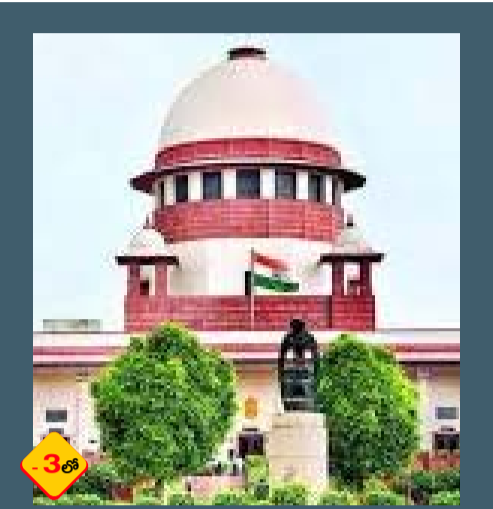
శబరిమలలో మహిళల ప్రవేశంపై నిషేధం