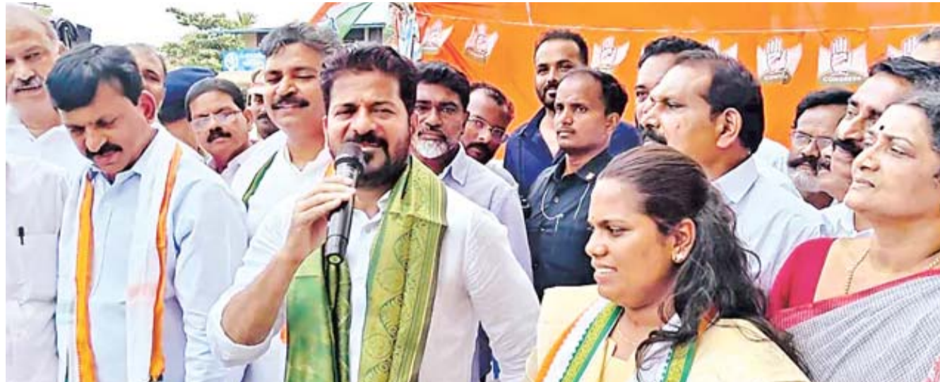
కేరళంలో ఇక ఎల్ డి ఎఫ్ కు విజయన్, మోడీ మంచి మిత్రులు