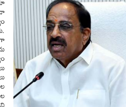
అధికారులు చర్యలు తీసుకోవాలని ఆదేశించారు. రైతుల సందేహాలను నివృత్తి చేయడంతో పాటు, రైతులకు అధునిక వ్యవసాయ పద్ధతులపై అవగాహన కల్పించడమే ఈ కార్యక్రమ లక్ష్యమని తెలిపారు. యూరియా యాప్ పై రైతుల అభిప్రాయాలను మంత్రి అడిగి తెలుసుకున్నారు. యూరియా యాప్ తో రైతుల ముఖాముఖి మాట్లాడిన మంత్రి.. ఈ సందర్భంగా యూరియా యాప్ మరియు యూరియా వినియోగం వంటి అంశాలపై రైతుల అభిప్రాయాలను తెలుసుకున్నారు. ఈ సందర్భంగా మంత్రి మాట్లాడుతూ.. రైతులకు యూరియా యాప్ నిర్వహించే రైతులు అధికంగా పాల్గొనేలా భవిష్యత్తులో కూడా యూరియా యాప్ తోనే

హైదరాబాద్: దేశంలోనే అధికంగా యూరియా వాడుతున్న రాష్ట్రాలలో తెలంగాణ కూడా ఉందని, ఇది ఎంత మాత్రం ఆమోదయోగ్యం కాదని మంత్రి తుమ్మల నాగేశ్వరరావు అన్నారు. రైతులు యూరియాను అధికంగా వినియోగించవద్దని కోరారు. యూరియాను అధికంగా వాడటం వల్ల, నేల అలోగ్యం దెబ్బతినడంతో పాటు, రానురాను దిగుబడులు కూడా తగ్గుతాయని, వీడ పీడల సమస్యలు పెరుగుతాయని తెలిపారు. ఇప్పుడు పంటల కోతల సమయం వచ్చిందని, రైతులు కోతల అనంతరం వచ్చే వంట వ్యర్థాలను కాల్చవద్దని అన్నారు. పంట వ్యర్థాలను కాల్చడం ద్వారా పర్యావరణం దెబ్బతింటుందని తెలిపారు. ప్రతి మంగళవారం నిర్వహించే రైతుసేవ కార్యక్రమంలో భాగంగా.. ఈ రోజు నిర్వహించిన రైతుసేవ కార్యక్రమంలో వ్యవసాయశాఖ మంత్రి సచివాలయం నుండి హాజరయ్యారు. వీడియో కాన్ఫరెన్స్ ద్వారా రైతులతో ముఖాముఖి మాట్లాడిన మంత్రి.. ఈ సందర్భంగా యూరియా యాప్ మరియు యూరియా వినియోగం వంటి అంశాలపై రైతుల అభిప్రాయాలను తెలుసుకున్నారు. ఈ సందర్భంగా మంత్రి మాట్లాడుతూ.. రైతులకు యూరియా యాప్ నిర్వహించే రైతులు అధికంగా పాల్గొనేలా భవిష్యత్తులో కూడా యూరియా యాప్ తోనే