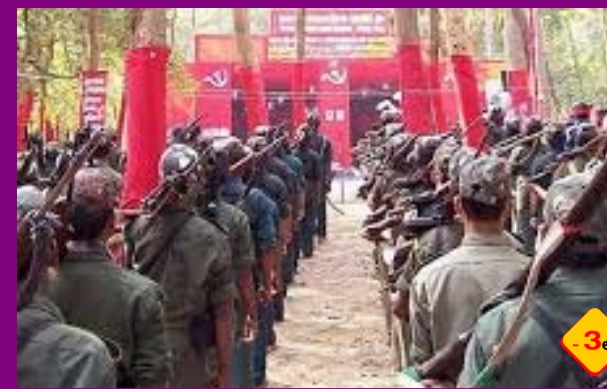
తెలంగాణలో మావోయిస్టుల శకం ముగిసింది