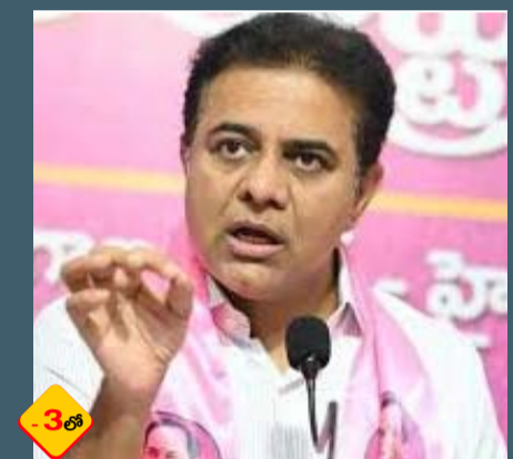
రైతుల భూములు లాక్కునే యత్నం దుర్మార్గం