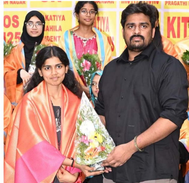
Mrudhula 996 MPC