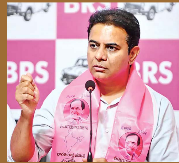
'తెరాస' గా మార్పుపై పార్టీలో