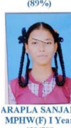
ARAPLA SANJANA MPHW(F) I Year 430/500 (86%)