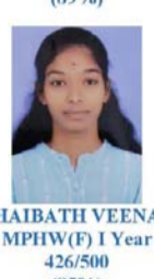
HAIBATH VEENA MPHW(F) I Year 426/500 (85%)