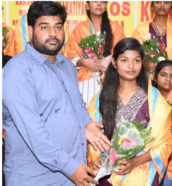
Y. Gouthami 991 MPC