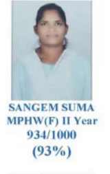
SANGEM SUMA MPHW(F) II Year 934/1000 (93%)