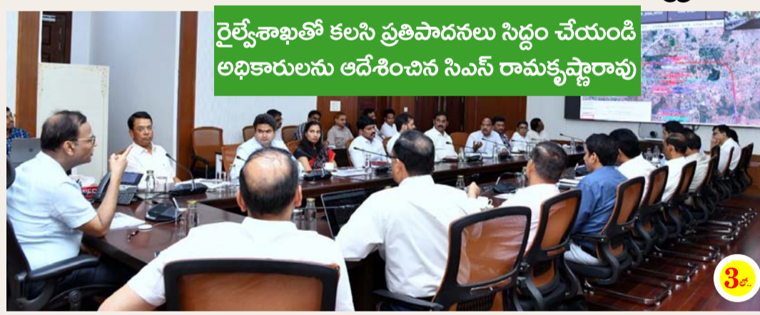
రైల్వే శాఖతో కలిసి ప్రతిపాదనలు సిద్ధం చేయండి అధికారులను ఆదేశించిన సీఎం రామకృష్ణారావు