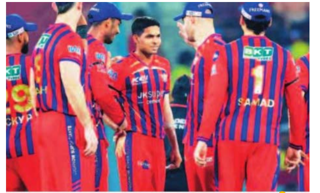
లభనపూ ఘన విజయం