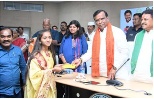
వేగుచుక్క స్కూల్స్, నిజామాబాద్.

- విద్యా విజయోత్సవంలో అర్జన్ ఎమ్మెల్యే, కలెక్టర్ వెల్లడి.