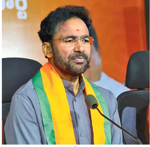
అనర్బుల ఓట్లు కచ్చితంగా తొలగిస్తారు

హైదరాబాద్: కేంద్ర ప్రభుత్వం ఇటీవల పనికి కనీస మద్దతు ధర పెంచినా.. రాష్ట్ర ప్రభుత్వ నిర్ణయంతో రైతుల ధాన్యం ఇంకా కల్లాలోనే ఉందని కేంద్ర మంత్రి జి.కిషన్ రెడ్డి విమర్శించారు. 'సర్'పై సీఎం రేవంత్ రెడ్డి తప్పుడు ప్రచారం చేస్తున్నారని మండిపడ్డారు. యుద్ధం వల్ల ఇంధనం ధరలు పెరిగితే అప్రజాస్వామికమని సీఎం ఆరోపించడం సరైనది కాదన్నారు. ఆదివారం భాజపా రాష్ట్ర కార్యాలయంలో ఆయన విలేజరుల సమావేశంలో పలు అంశాలపై మాట్లాడారు. "కాంగ్రెస్ ప్రభుత్వం రైతు డిక్షరీషన్ పేరుతో హామీలు ఇచ్చి మోసం చేసింది. రాష్ట్రంలో కనీసం ధాన్యం కొనలేని పరిస్థితి నెలకొంది. రైతులు అనేక ప్రాంతాల్లో ఆందోళనలు చేస్తున్నారు. యూపీవీ హయాంలో ధాన్యం క్వింటాకు రూ.1,300 గిట్టుటూ ధర ఉండేది. మోదీ ప్రభుత్వం దాన్ని రూ.2,360కు పెంచింది. ధాన్యం కొనుగోలుకు ప్రతి పైసా కేంద్రమే ఇస్తుంది. రాష్ట్రపై రూపాయి కూడా భారం పడదు. మొత్తం కేంద్రమే భరిస్తున్నప్పుడు రాష్ట్ర ప్రభుత్వం కొనుగోళ్లు ఎందుకు ఆలస్యం చేస్తుంది చెప్పాలి. రేవంత్ రెడ్డి సర్కారు ధాన్యం మీద బోసన్ అని చెప్పి మాట తప్పింది. రాష్ట్ర మంత్రులంతా ఒక్కో జిల్లాకు వెళ్లి కొనుగోళ్లపై దృష్టి పెట్టి రైతుల ఇబ్బందులు తీర్చాలి."