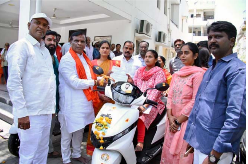
వేగుచుక్క స్టూన్, నిజామాబాద్:

- అర్బున్ ఎమ్మెల్యే ధన్ పాల్ సూర్యనారాయణ..