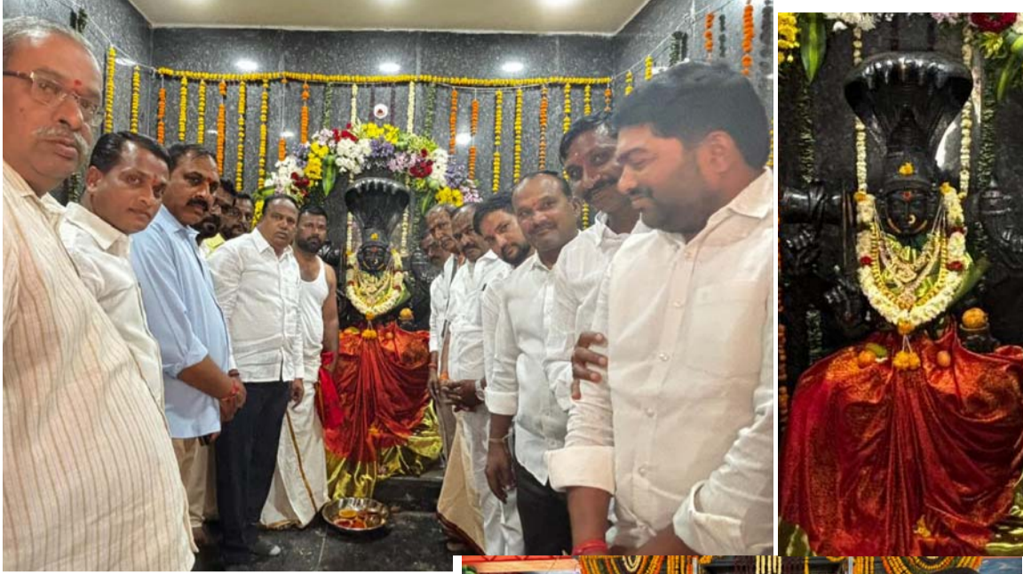
వేగుచుక్క స్టూన్, నిజామాబాద్: