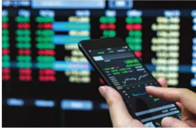
అంతర్జాతీయ వివరణలో ట్రెంట్ క్రూడ్ 104 డాలర్ల వద్ద ప్రేక్షకులను దండగం. బంగారం టెన్సు 4518 డాలర్ల వద్ద కొనసాగుతోంది.

ముంబయి: దేశీయ స్టాక్ మార్కెట్ సూచీలు నష్టాల్లో ముగిశాయి. బీసీ, ఎఫ్ఎంసీజీ స్టాక్స్పై ఒత్తిడి కారణంగా సూచీలు ప్రభావితమయ్యాయి. ఉదయం లాభాల్లో ప్రారంభమైన సూచీలు చివరికి నష్టాల్లోకి జారుకున్నాయి. సెన్సెక్స్ 135.03 పాయింట్లు నష్టపోయి 75,183.36 పాయింట్ల వద్ద ముగియగా.. నిఫ్టీ 4.30 పాయింట్ల నష్టంతో 23,654.70 వద్ద స్థిరపడింది. ఆర్బీఐ రంగ ప్రవేశంతో దారలతో రూపాయి విలువ 63 పైసలు బలపడి 96.23కు చేరుకుంది. ఉదయం 75.732.42 పాయింట్ల వద్ద (క్రితం ముగింపు 75,318.39) లాభాల్లో ప్రారంభమైన సూచీ.. ఇంటాడెల్ 74,996.78 - 75,945.79 మధ్య కదలాడింది. నెస్లెక్స్ 30 సూచీలో బజాజ్ ఫైనాన్స్, టెక్ మహింద్రా, హిందుస్థాన్ యూనిలివర్, ఇన్ఫోసిస్, బజాజ్ ఫిన్సర్వీస్ పేర్లు ప్రధానంగా నష్టపోయాయి. ఇండిగో, బీఈఎల్, ట్రెంట్, అదానీ పోర్ట్స్, అల్రాటిక్ సిమెంట్ పేర్లు లాభపడ్డాయి.