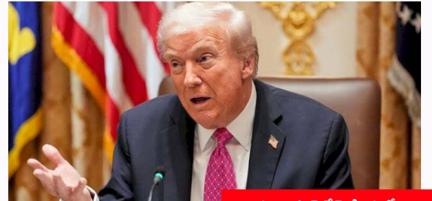
హర్యాజీ జలసంధి ఎవరి సొత్తు కాదు

చర్చలు విఫలమైతే వెనక్కి తగ్గడం అనుసరిస్తే రక్షణ మంత్రిని రంగంలోకి దిద్దిన అశ్వాయుధాలు సంపాదించకూడదు ప్రపంచ భద్రత కోసం ప్రయత్నిస్తున్నాం అమెరికా అధ్యక్షుడు ట్రంప్ తీవ్ర వ్యాఖ్యలు