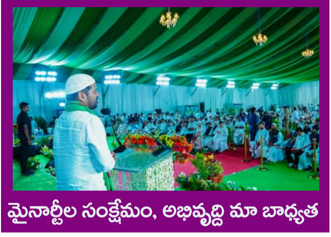
మైనార్టీల సంక్షేమం, అభివృద్ధి మా బాధ్యత

PUBLISHED FROM HYDERABAD CIRCULATED BY RANGAREDDY, NALGONDA, KHAMMAM, KARIMNAGAR, WARANGAL, MAHABOONAGAR, MEDAK, NIZAMABAD, ADILABAD