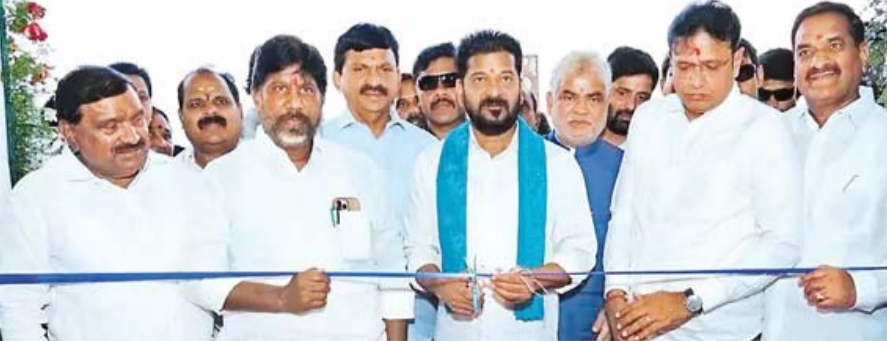
డిసెంబర్లోనూ గ్లోబల్ సమిట్ నిర్వహిస్తాం అని సీఎం రేవంత్ రెడ్డి తెలిపారు. కట్టాకోరులు బాధపడినా చర్యలే.. తమ ప్రయత్నం అంతమైతే ఫ్యూచర్ సిటీ పోటీ కర్రలు మీకుతాం.. తోకలు కత్తిరిస్తామని హెచ్చరించారు. తెలంగాణకు 60 శాతం ఆదాయం

కలిసి తెలంగాణ అభివృద్ధికి అడ్డుపడుతున్నారని పైర్ అయ్యారు. కడుపునొందా విషం నింపుకొని కుట్రలు చేస్తున్నారని ఆగ్రహించారు. ఏళ్లకొద్దీ ఏడవండ్ల.. తాము అభివృద్ధి చేస్తూనే ఉంటామని స్పష్టం చేశారు. నిన్ను 2 గంటల వరకూనే హైదరాబాద్ వరదయమైందని చెప్పాకొచ్చారు. ఇదేనా మి పదేళ్ల అభివృద్ధి? అని ప్రశ్నించారు. చెరువులు, నాలాలు కట్టా చేస్తే నహించేది లేదని హెచ్చరించారు. బతుకమ్మ కుట్ర ఏమైనా ఎడ్ల సుధాకర్ తాత ఆస్తినా అని ప్రశ్నించారు. అంధరిపేటలో ఉన్న బతుకమ్మకుండు ఎడ్ల సుధాకర్ కు కేసీఆర్ రాసిచ్చారు. ఆనాటి నాయకులు ప్రభుత్వ భూముల్ని ఆక్రమించారు. అందుకే, హైదరాబాద్ అక్రమ కట్టలను తొలగిస్తున్నాం. చెరువులను పునరుద్ధరిస్తున్నాం. లేక ఏకానమీ సృష్టించడానికి కాంగ్రెస్ ప్రభుత్వం ప్రయత్నాలు చేస్తోంది. గ్లోబల్ సమిట్ ద్వారా ప్రపంచదేశాలను ఇక్కడికి రప్పించాం.