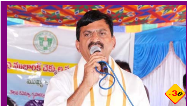
సర్ ప్రక్రియ .. ఓ భూతం లాంటిది