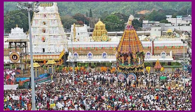
తిరుమలలో పెరిగిన భక్తుల రద్దీ

PUBLISHED FROM HYDERABAD CIRCULATED BY RANGAREDDY, NALGONDA, KHAMMAM, KARIMNAGAR, WARANGAL, MAHABOONNAGAR, MEDAK, NIZAMABAD, ADILABAD