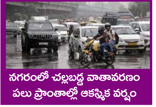
నగరంలో చల్లబడ్డ వాతావరణం పలు ప్రాంతాల్లో ఆకస్మిక వర్షం

PUBLISHED FROM HYDERABAD CIRCULATED BY RANGAREDDY, NALGONDA, KHAMMAM, KARIMNAGAR, WARANGAL, MAHABOONAGAR, MEDAK, NIZAMABAD, ADILABAD